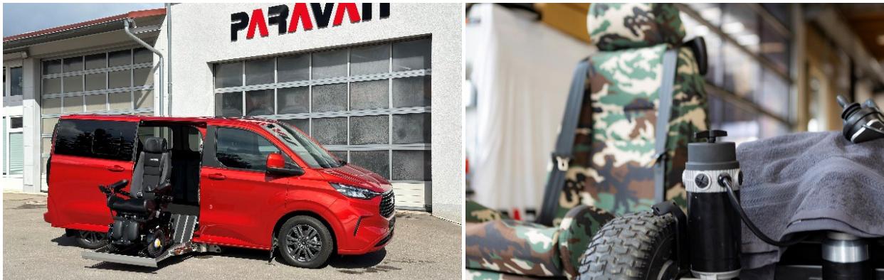
Der PARAVAN Ford Tourneo Custom und der PARAVAN PR 4X – hier noch bei der Fertigstellung – das sind die PARAVAN-Messehighlights der Rehacare 2024 in Düsseldorf

Auf der REHACARE Düsseldorf vom 25. bis 28. September 2024 präsentiert die PARAVAN GmbH auf 150 Quadratmetern ihr ganzheitliches Mobilitätskonzept – von der Fahrzeuganpassung über das umfassende Elektro-Rollstuhlportfolio bis hin zum Fahr- und Lenksystem Space Drive, das Menschen mit schwersten Bewegungseinschränkungen ermöglicht, selbstständig ein Fahrzeug zu steuern. Im Mittelpunkt steht dabei der PARAVAN-Grundsatz „alles aus einer Hand“. Kompakt an einem Stand können die Besucher in die PARAVAN-Produktwelt eintauchen. Auf dem Außengelände haben sie die Gelegenheit, sich im PARAVAN-Fahrschulfahrzeug wieder selbst ans Steuer zu setzen und ihre persönliche Mobilität zu „erfahren“. Ein besonderes Highlight ist die Produktpremiere des allradgetriebenen Offroad-Rollstuhls PR 4X. Die PARAVAN-Mobilitätsberater und Fahrlehrer stehen Ihnen während der Messe Rede und Antwort. Besuchen Sie uns in Halle 6, Stand 6C55.