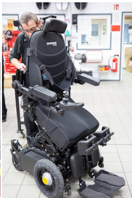
Letzter Feinschliff, der PR 40 – der neue Elektro-Stehrollstuhl mit Sitz-, Liege- und Stehfunktion im unteren Preissegment – wird auf der REHAB in Karlsruhe das erste Mal der Öffentlichkeit präsentiert.