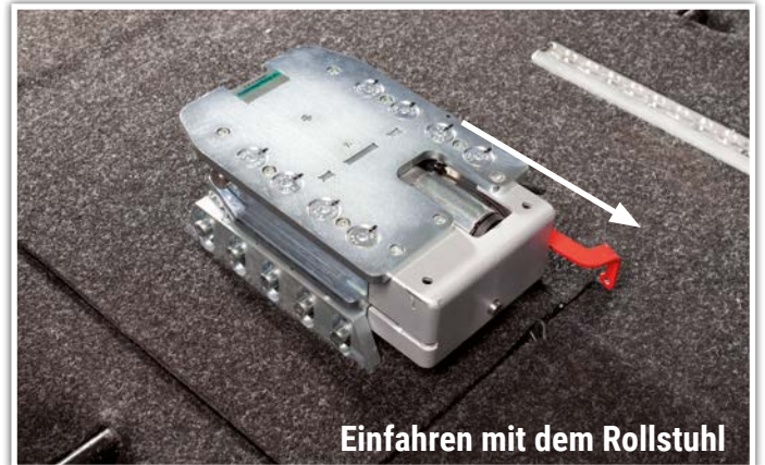
Einfahren mit dem Rollstuhl